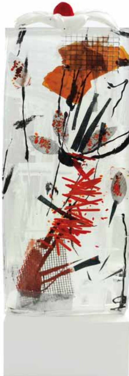
Glasobjekt mit Stahlsockel. Königsblüte III, 2015 54 x 16 x 13cm