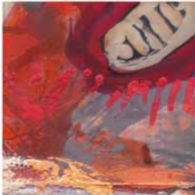
Rote Ewigkeit, 2016 Collage: Öl auf Leinwand, 150 x 120cm