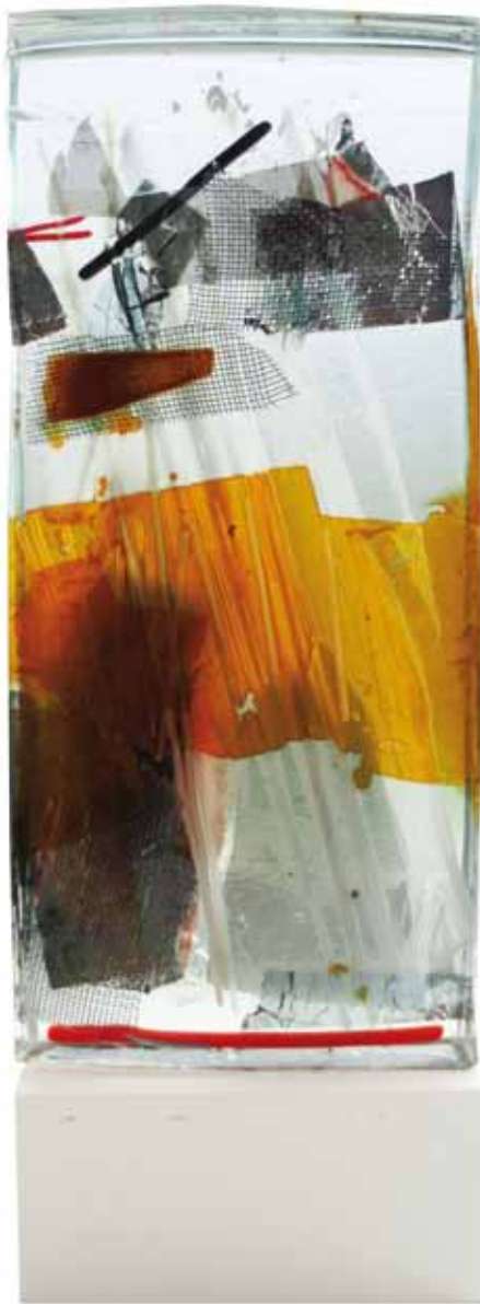
Glasobjekt mit Stahlsockel. Red line, 2014 45 x 16 x 4cm