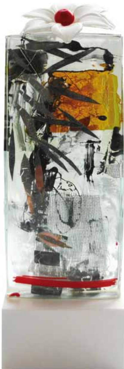
Glasobjekt mit Stahlsockel. Königsblüte I, 2015 54 x 16 x 13cm