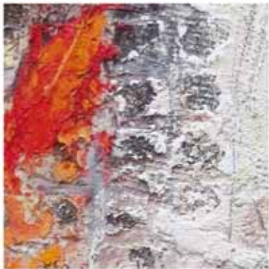
Teehaus , 2014/16 Collage: Öl auf Leinwand, 150 x 120cm