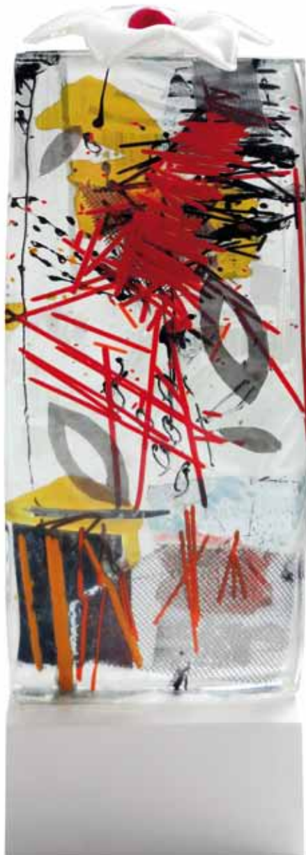
Glasobjekt mit Stahlsockel, Königsblüte II, 2015 54 x 16 x 13cm