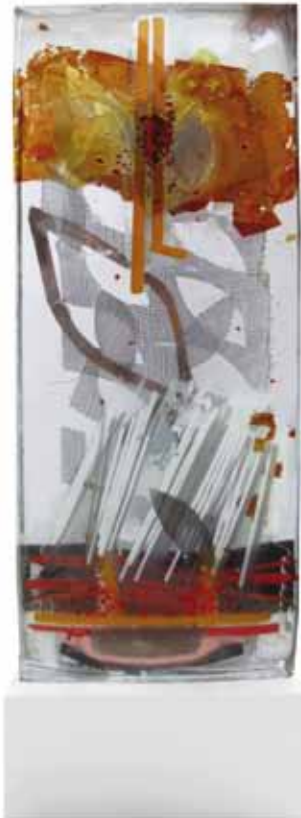
Glasobjekt mit Stahlsockel, Herbarium III , 2016 47 x 16 x 4cm