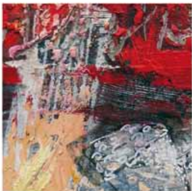
Roter Berg-Mugel, 2015/16 Collage: Öl auf Leinwand, 150 x 120cm