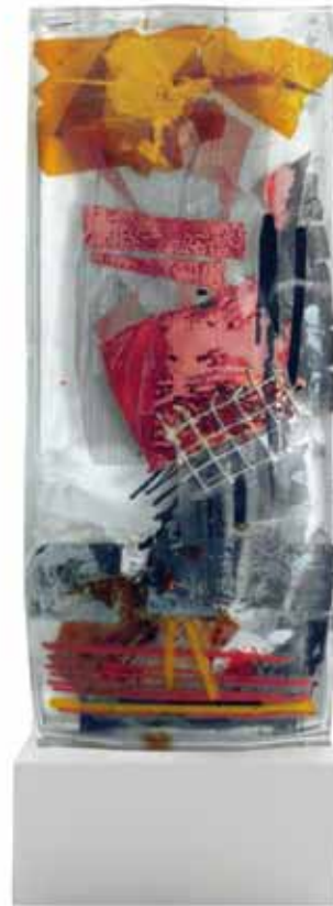
Glasobjekte mit Stahlsockel. Herbarium V - VI, 2016 47 x 16 x 4cm