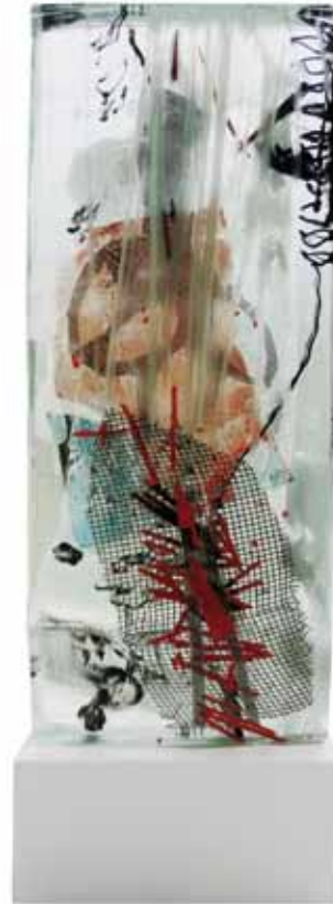
Glasobjekte mit Stahlsockel. Herbarium I - II, 2014/15 47 x 16 x 4cm