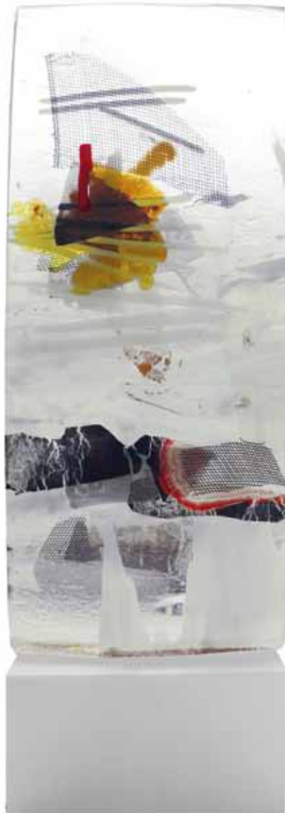
Glasobjekt mit Stahlsockel. Vereist, 2014 47 x 16 x 4cm