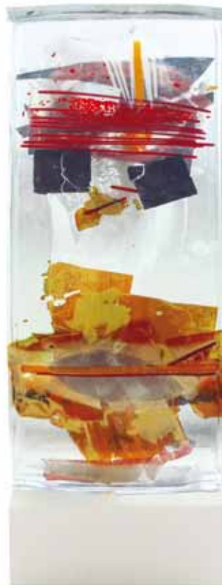
Glasobjekt mit Stahlsockel, Herbarium IV, 2016 47 x 16 x 4cm